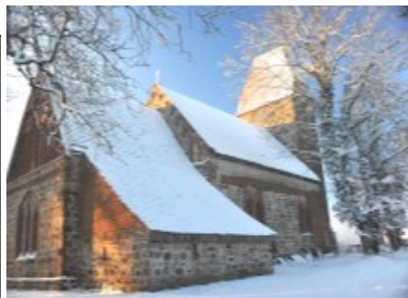
Das „Winterkleid“ der Dorfkirche Bülow